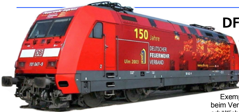
Von den Gleisen der Deutschen Bahn auf die Modell-eisenbahn: Die DFV-Lok wird als H0-Modell gebaut.